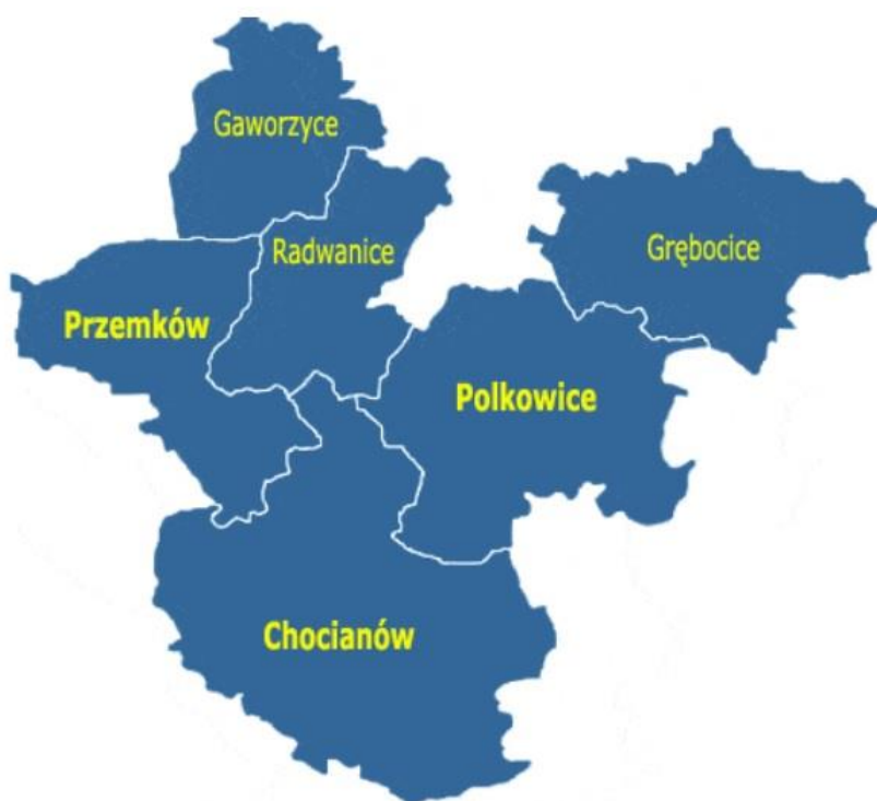
Rysunek 1 Położenie gminy Chocianów na tle powiatu polkowickiego.

Gmina miejsko-wiejska Chocianów leży na terenie województwa dolnośląskiego w powiecie polkowickim. Sąsiaduje bezpośrednio z gminami: Radwanice, Polkowice, Lubin (gmina wiejska), Chojnów (gmina wiejska), Gromadka, Przemków. Przez teren gminy przebiegają drogi wojewódzkie 328, 331 i 335, zaś w niewielkiej odległości od granic gminy także droga ekspresowa S3, drogi krajowe nr 12, 36, 94 oraz autostrady A4 i A18.